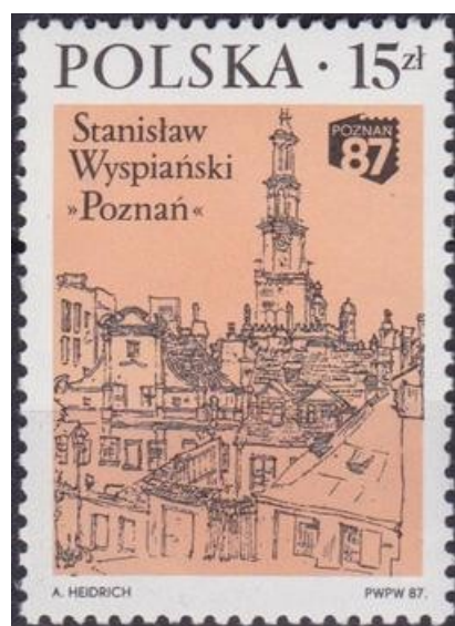
1978: портрет Выспянского на марке из серии "Польские драматурги" (6 шт.). 1987: рисунок "Познань" (18).