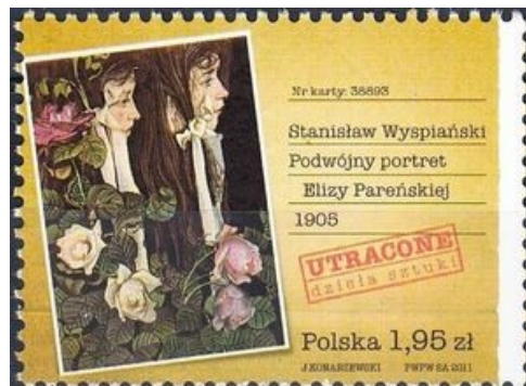
2007: Год Станислава Выспянского в Польше; картина "Хеленка с цветами в вазе". 2011: "Двойной портрет Элизы Паренской"; из серии «Потерянные картины» (10 шт., марки серии выпускались также в сцепках по 3 и малыми листами).

Две из этих марок – "Аполлон" и Выспянский-драматург – непосредственно связывают замечательного польского поэта и художника с А. (трудно сказать, что в его творчестве первично, это видно и по маркам). Марки, конечно, не воспроизводят в полной мере художественное мастерство автора; для этого лучше найти "исходный" вид в Интернете. Добавлю, что Выспянскому установлен монумент в Кракове.