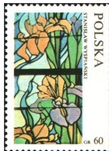
1971: витражи "Аполлон", "Водяные лилии", "Элементы" из серии "Витражи польских мастеров" (8 шт).